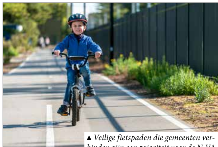
▲ Veilige fietspaden die gemeenten verbinden zijn een prioriteit voor de N-VA.

Met 'Mobiliteit als Dienst' hoef je niet langer een auto, fiets of treinabonnement te bezitten. Je kan gewoon een deelauto of