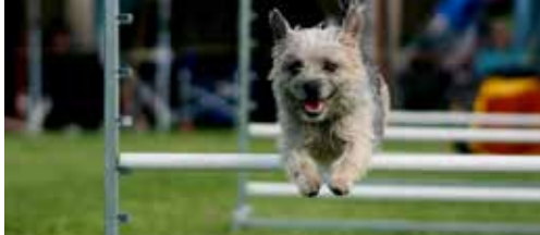
N-VA Haacht in de weer voor hondenclub p. 2