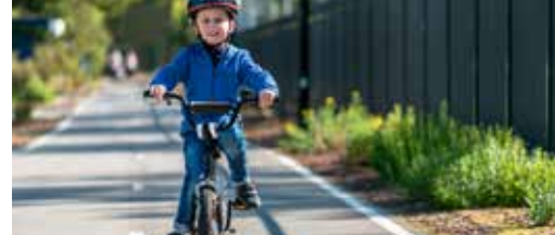
Verkeersproblemen samen aanpakken p. 3