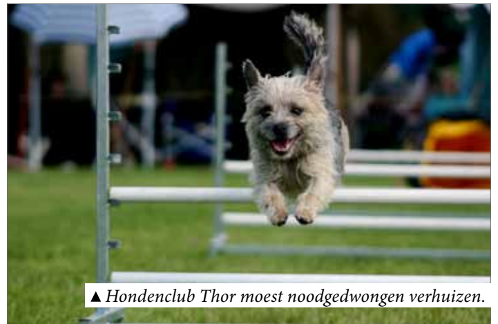
▲ Hondenclub Thor moest noodgedwongen verhuizen.