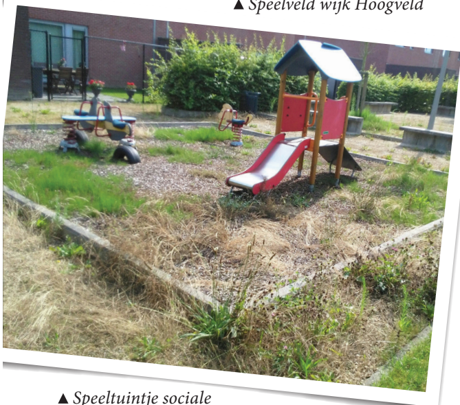
▲ Speeltuintje sociale woningen Neerstraat