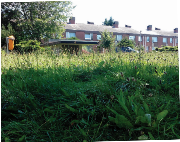
▲ Speelveld wijk Hoogveld

N-VA Haacht vraagt daarom dat de gemeente regelde onderhoudsbeurten uitvoert op de speelvelden in alle wijken.