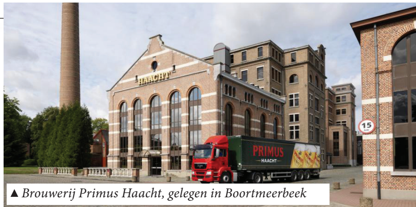
▲ Brouwerij Primus Haacht, gelegen in Boortmeerbeek