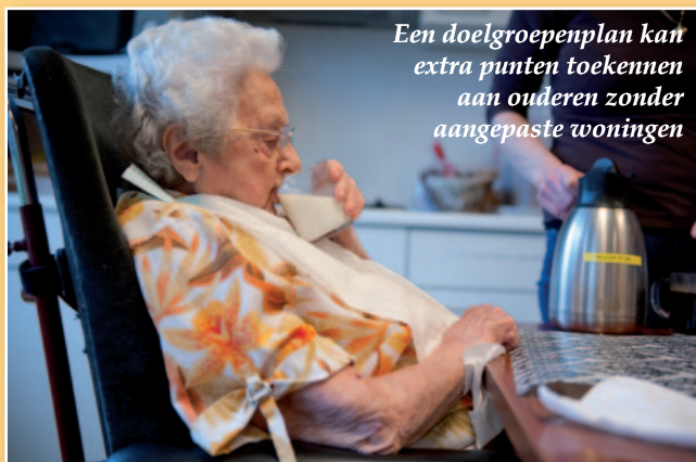
Een doelgroepenplan kan extra punten toekennen aan ouderen zonder aangepaste woningen

Na vijf jaar bestuur heeft de meerderheid nog steeds geen initiatieven genomen inzake sociale woningbouw. De lopende of gerealiseerde projecten (Kouterhof, Postweg, Neerpleintje,...) zijn ofwel gestart in de vorige legislatuur of ondernomen door intergemeentelijke sociale huisvestingsmaatschappijen.