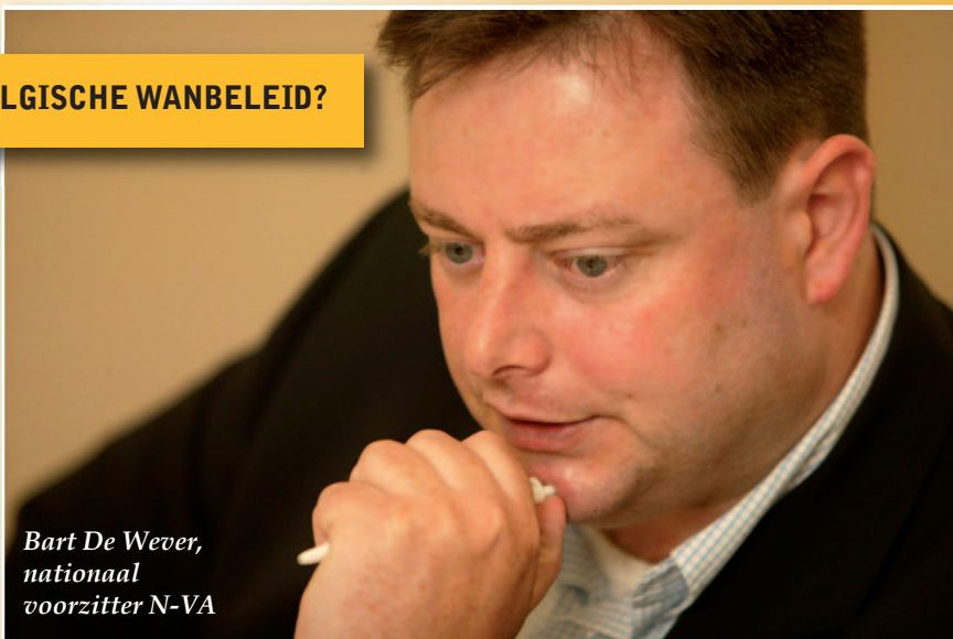
Bart De Wever, nationaal voorzitter N-VA

Want de socialisten dromen van hogere belastingen. Daarvan zullen vooral de Vlamingen de dupe zijn. En als het van Open Vld afhangt, moet Vlaanderen overschotten boeken zodat alle andere overheden de tekorten kunnen blijven opstapelen. Maar is het toeval dat de federale en de Brusselse regering, allebei met een Open Vld-minister van Begroting, de grootste tekorten hebben? Budgettaire discipline valt hen blijkbaar zwaar!