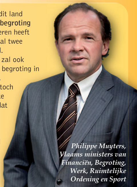
Philippe Muylers, Vlaams ministers van Financiën, Begroting, Werk, Ruimtelijke Ordening en Sport

Als enige overheid in dit land heeft Vlaanderen een begroting in evenwicht. Vlaanderen heeft de voorbije twee jaar al twee miljard euro bespaard. De Vlaamse Regering zal ook de volgende jaren een begroting in evenwicht voorleggen. Als er geleidelijk aan toch wat budgettaire ruimte komt, investeren we dat zoals Europa vraagt: in onze economie (O&O, infrastructuur, werk ...) en in sociaal beleid (kinderopvang, wachtlijsten gehandicapten, kindpremie ...).