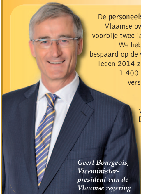
Geert Bourgeois, Viceminister- president van de Vlaamse regering

De personeelsbudgetten van de Vlaamse overheid daalden de voorbije twee jaar met 5 procent. We hebben ook drastisch bespaard op de werkingsmiddelen. Tegen 2014 zullen er bovendien 1 400 ambtenaren op de verschillende Vlaamse departementen niet stelselmatig vervangen worden. Een besparing van 50 miljoen euro per jaar!