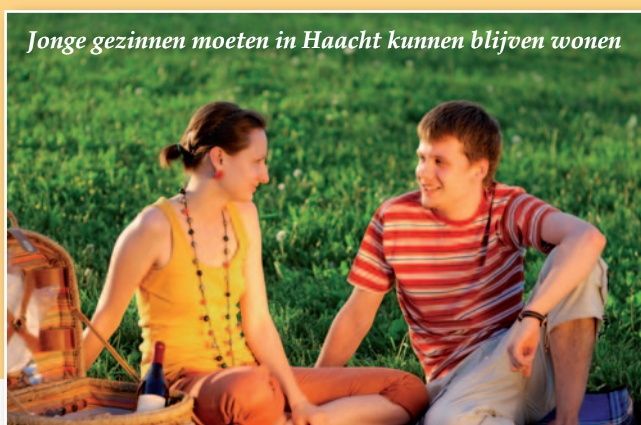
Jonge gezinnen moeten in Haacht kunnen blijven wonen

Het bouwen van sociale woningen neemt altijd een lange tijd in beslag, van idee tot afwerking. N-VA Haacht hoopt dat er deze legislatuur nog kan begonnen worden met deze plannen.