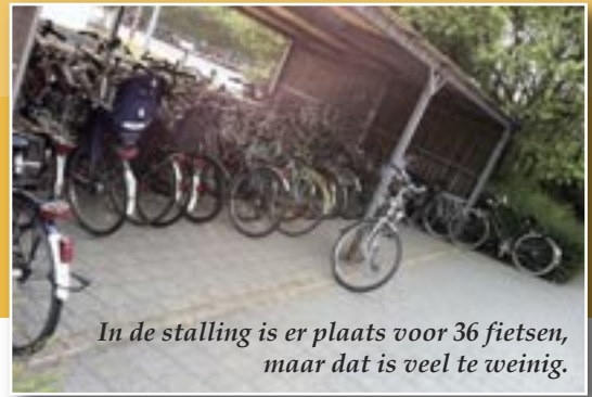
In de stalling is er plaats voor 36 fietsen, maar dat is veel te weinig.

Een doorn in het oog van menig pendelaar als zij of hij 's ochtends de trein neemt: 'Geen plaats meer voor mijn fiets in het rek'. Het overkomt de pendelaars van de halte Wespelaar-Tildonk dagelijks.