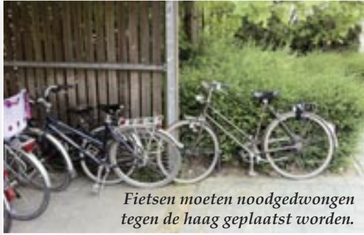
Fietsen moeten noodgedwongen tegen de haag geplaatst worden.

Een doorn in het oog van menig pendelaar als zij of hij 's ochtends de trein neemt: 'Geen plaats meer voor mijn fiets in het rek'. Het overkomt de pendelaars van de halte Wespelaar-Tildonk dagelijks.