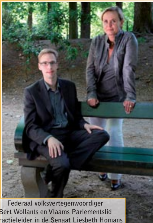
Federaal volksvertegenwoordiger Bert Wollants en Vlaams Parlementslid en fractieleider in de Senaat Liesbeth Homans zijn de N-VA-specialisten op het vlak van energie.

Uw energiefactuur swingt de pan uit. De toekomstige energiebevoorrading moet verzekerd blijven. En het is in Vlaanderen weinig realistisch om alle energie voor 100 % uit hernieuwbare bronnen te halen. Daarom ontwikkelde de N-VA een evenwichtige totaalvisie op energie.