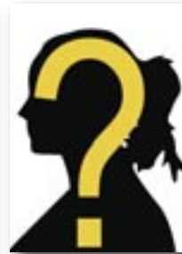
En jij ... ?