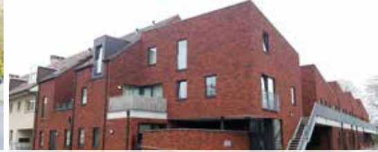
Seniorenhuisjes Spreeuwenstraat nog steeds bedreigd (p. 3)