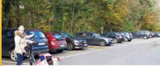
N-VA vraagt bouwpaauze voor appartementen (p. 2)